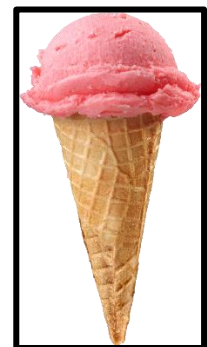
Strawberry ice cream