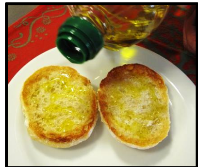
Toasts with olive oil