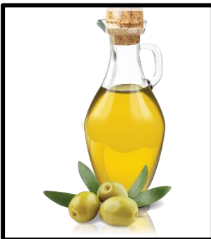
Olive oil (oliv oil)